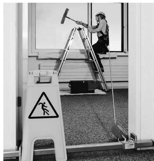
Fig. 7: pulizia delle finestre. La persona è munita di un dispositivo anticaduta di tipo retrattile utilizzabile orizzontalmente. L'apparecchio è fissato a una traversa agganciata al telaio della porta.

È possibile che nella vostra azienda esistano altre fonti di pericolo riguardanti il tema della presente lista di controllo. In tale caso, occorre adottare le necessarie misure di sicurezza (vedi retro).