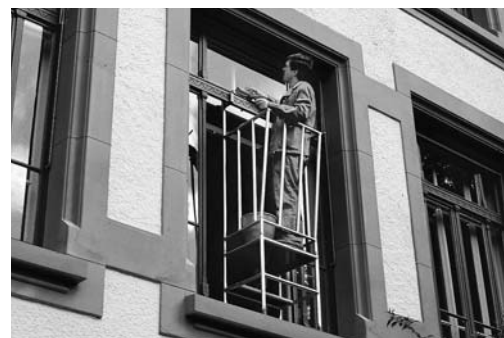
Fig. 6: parapetto di protezione agganciato tra la finestra e il telaio.

Consultare anche le liste di controllo «Utensili elettrici portatili» (codice 67092.i), «Elettricità sui cantieri» (codice 67081.i) e «Pavimenti» (codice 67012.i)