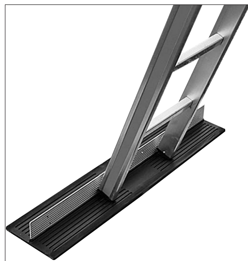
Fig. 2: con una base adeguata (ad es. tappetino antiscivolo) si impedisce che i piedi della scala scivolino.