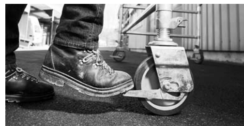
Fig. 4: prima di salire bloccare i freni delle ruote.

Consultare anche la lista di controllo «Ponteggi mobili su ruote» (codice 67150.i)