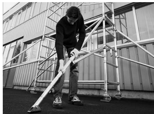
Fig. 3: dispositivo per evitare il ribaltamento del ponteggio mobile.