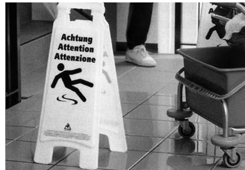
Fig. 5: segnale che indica un pavimento scivoloso. Questo cartello può essere ordinato spesso la Suva (codice 99103).

Consultare anche le seguenti pubblicazioni Opuscolo «Sostanze pericolose – Tutto quello che è necessario sapere» (codice 11030.i), lista di controllo «Protezione della pelle sul posto di lavoro» (codice 67035.i), film «Napò in: Attenzione ai prodotti chimici!» (codice DVD 351)